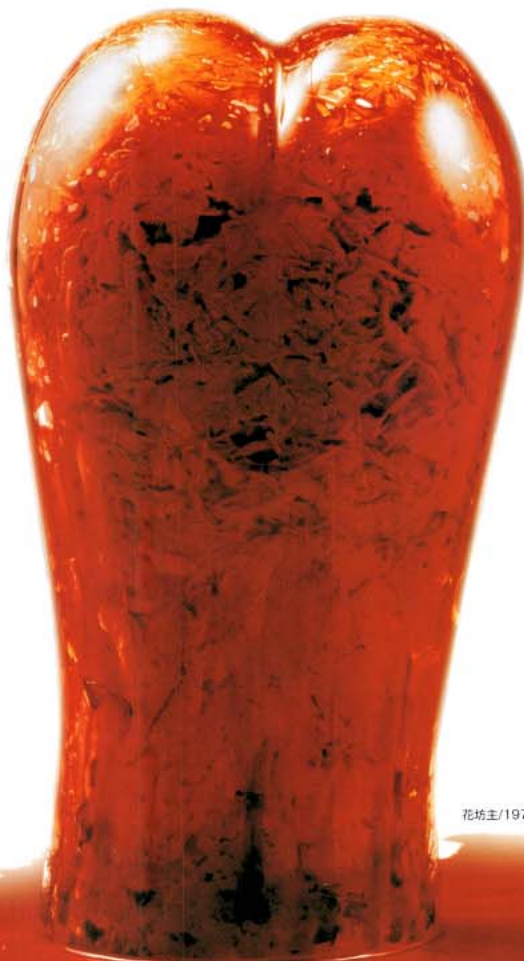
花坊主/1973(カーネーション900本、自作ガラス器)