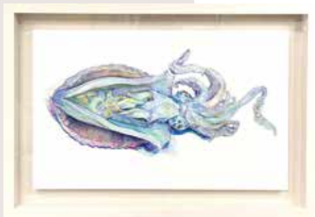
《アオリイカの解剖》2022年