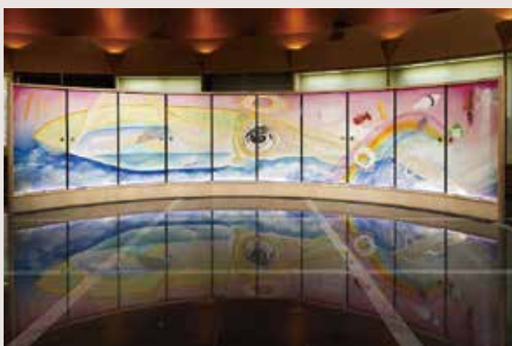
《イカイカ天国》2021年(いきいきセンターくりの郷)