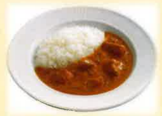
濃厚バターチキンカレー