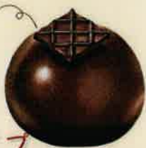
アイスタイフ 3層チョコの濃厚ドームケーキ