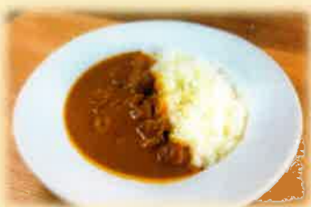
シーフードカレー