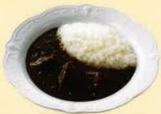
ローストスパイスカレー