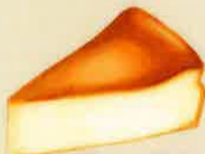
ベーカドチーズケーキ