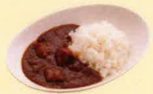
欧風ビーフカレー