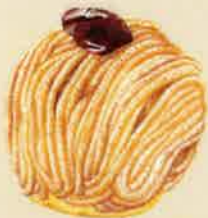
渋皮栗のモンブラン