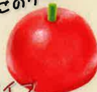
アイスタイフ 真っ赤なりんごのケーキ