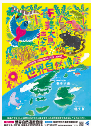
鹿児島県世界自然遺産奄美保全・活用事業 / 2021