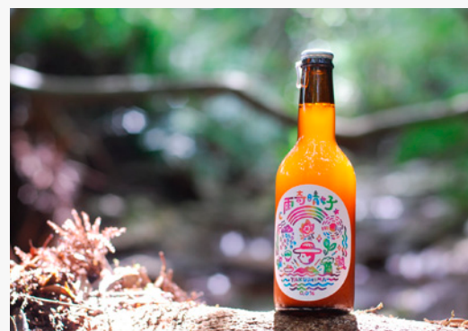
▲雨奇晴好ラベル(屋久島八万寿茶園) / 2023