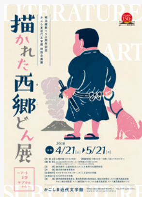
描かれた西郷どん展 / 2018